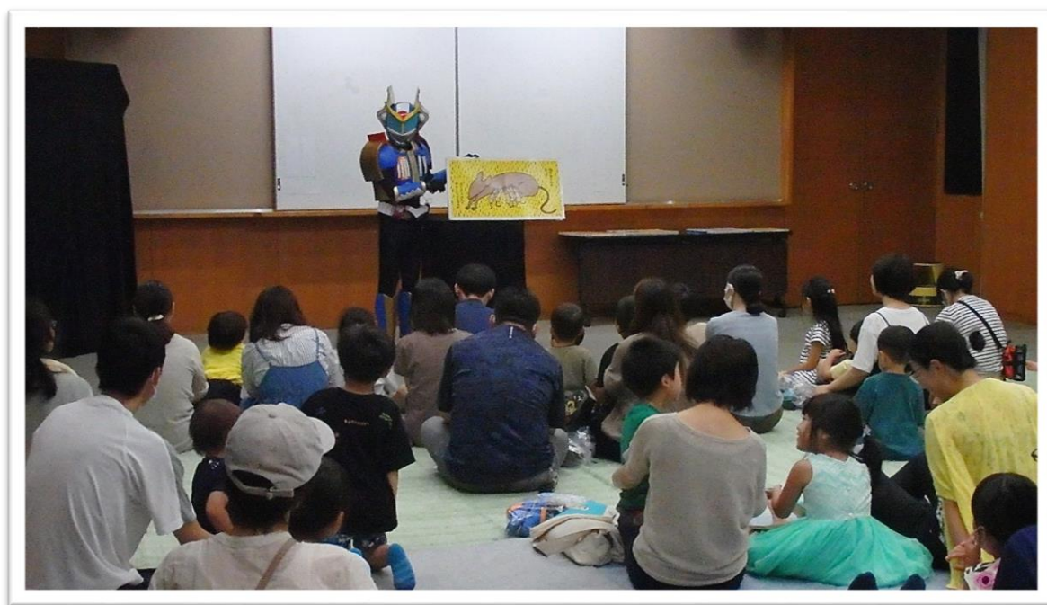
「輝望閃詩ダクシオン ヒーローおはなし会」より